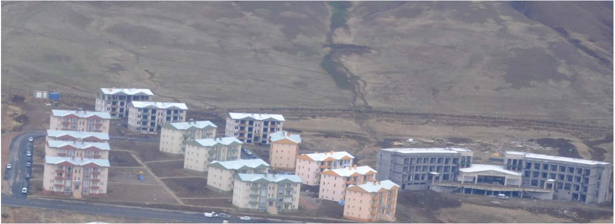
Resim 7. Misafirhane ve Lojmanlar

“Lojmanlar ve Sosyal Tesisler” projesi kapsamında, 2012 yılında yatırım programına dâhil olan ve 2012 yılında ihalesi yapılan “6.000 m 2 Misafirhane ve 48 Daire Lojmanlar”ın, yapım işi, 2015 yılı sonu itibari ile % 91'i tamamlanmış ve inşaat çalışmaları devam etmektedir.