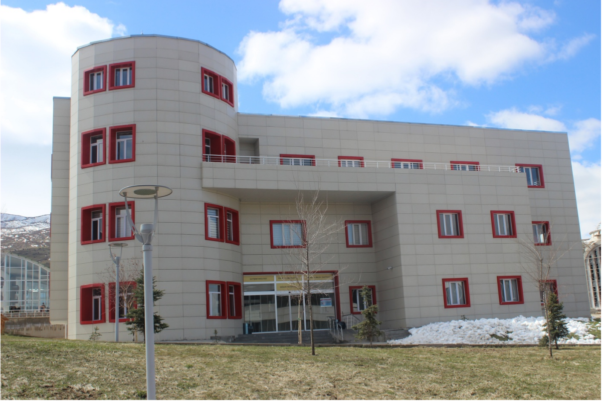
Resim 4. Enstitü Binası

Yurt Çimento San. ve Tic. A.Ş. tarafından yapımı üstlenilen Enstitü binası tamamlanmıştır.