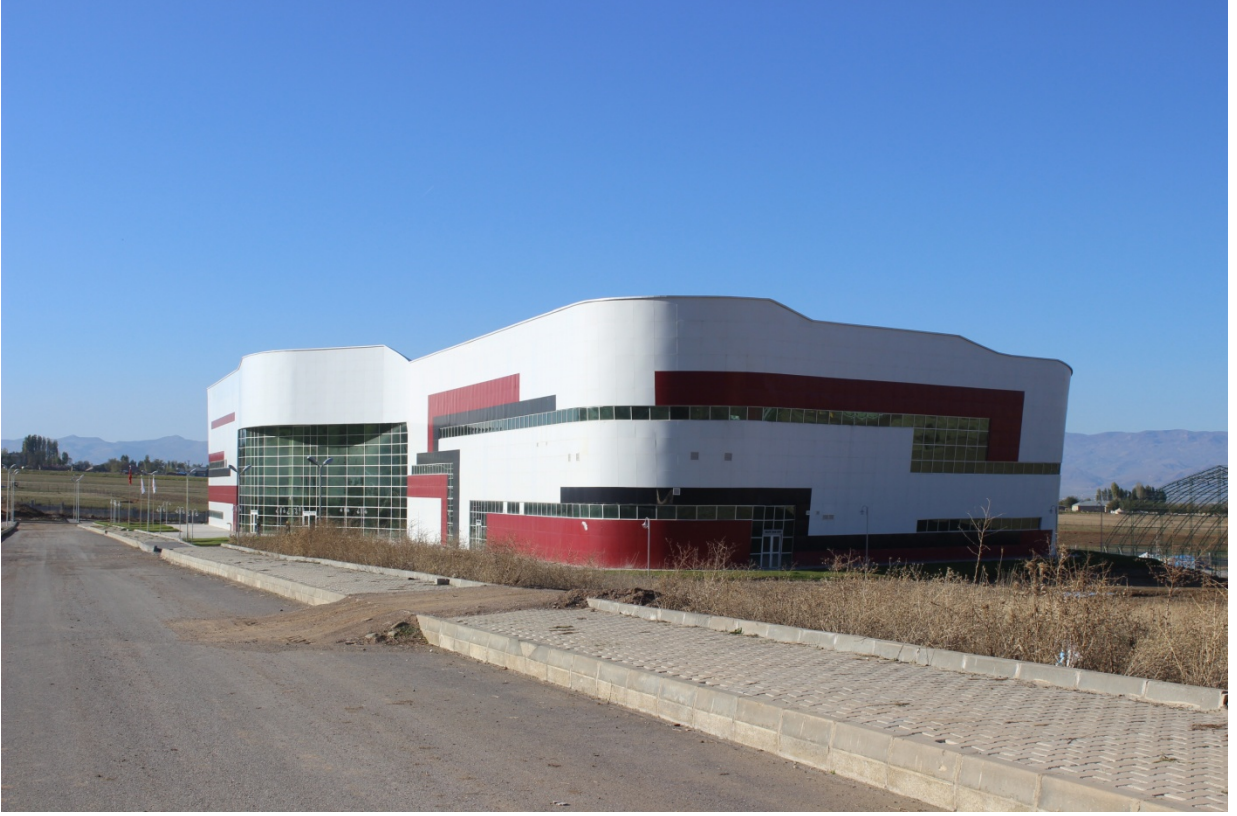
Resim 8. Kapalı Spor Tesisleri

Ayrıca, “Açık ve Kapalı Spor Tesisleri” projesine bağlı olarak 2014 yılında ihalesi yapılan 2.000 m 2 kapalı alana sahip “Açık Spor Tesisleri” çizim aşamasındadır.