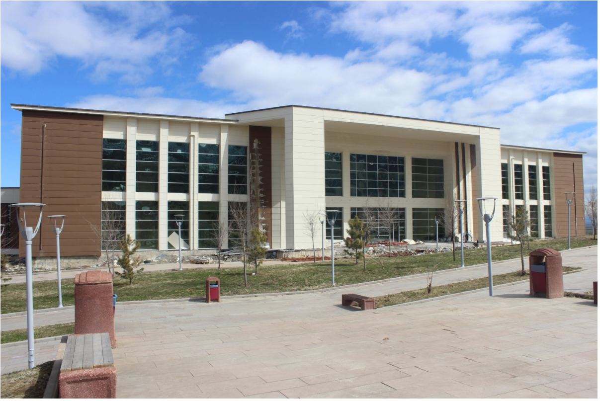
Resim 2. Kongre ve Kltr Merkezi