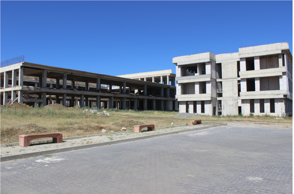
Resim 3. Fen Edebiyat Fakltesi 1'inci ve 2'nci Etap