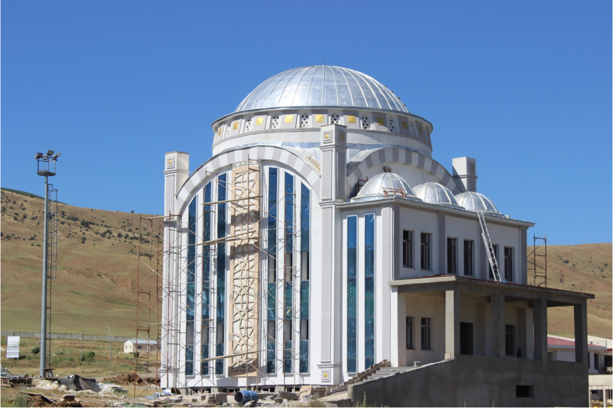
Resim 6. Gazze Cami

Türkiye Diyanet Vakfı tarafından yapımı üstlenilen Kampüs Cami'nin, inşaat çalışmaları devam etmektedir.