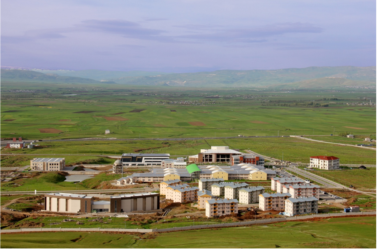
Resim 1. Kampüs Alanı

“Kampüs Altyapısı” projesine baęlı olarak, 2013 yılında ihalesi yapılan “Çevre Düzenlemesi” yapım işi, 2015 yıl sonu itibariyle % 100’ü tamamlanmıştır.