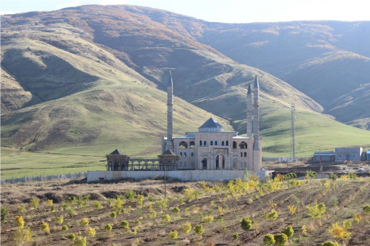
Resim 5. Kampüs Cami

Yurt Çimento San. ve Tic. A.Ş. tarafından yapımı üstlenilen Enstitü binası tamamlanmıştır.